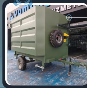
ERDTECH Tactical Trailer Platform